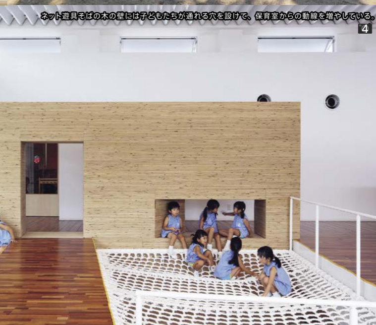
4 ネット遊具そばの木の壁には子どもたちが通れる穴を設けて、保育室からの動線を増やしている。