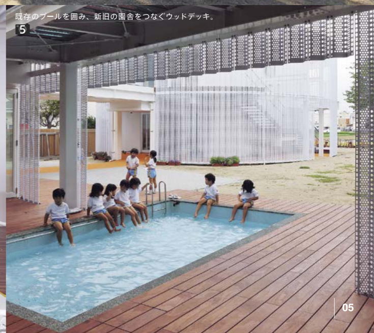
5 既存のプールを囲み、新旧の園舎をつなぐウッドデッキ。