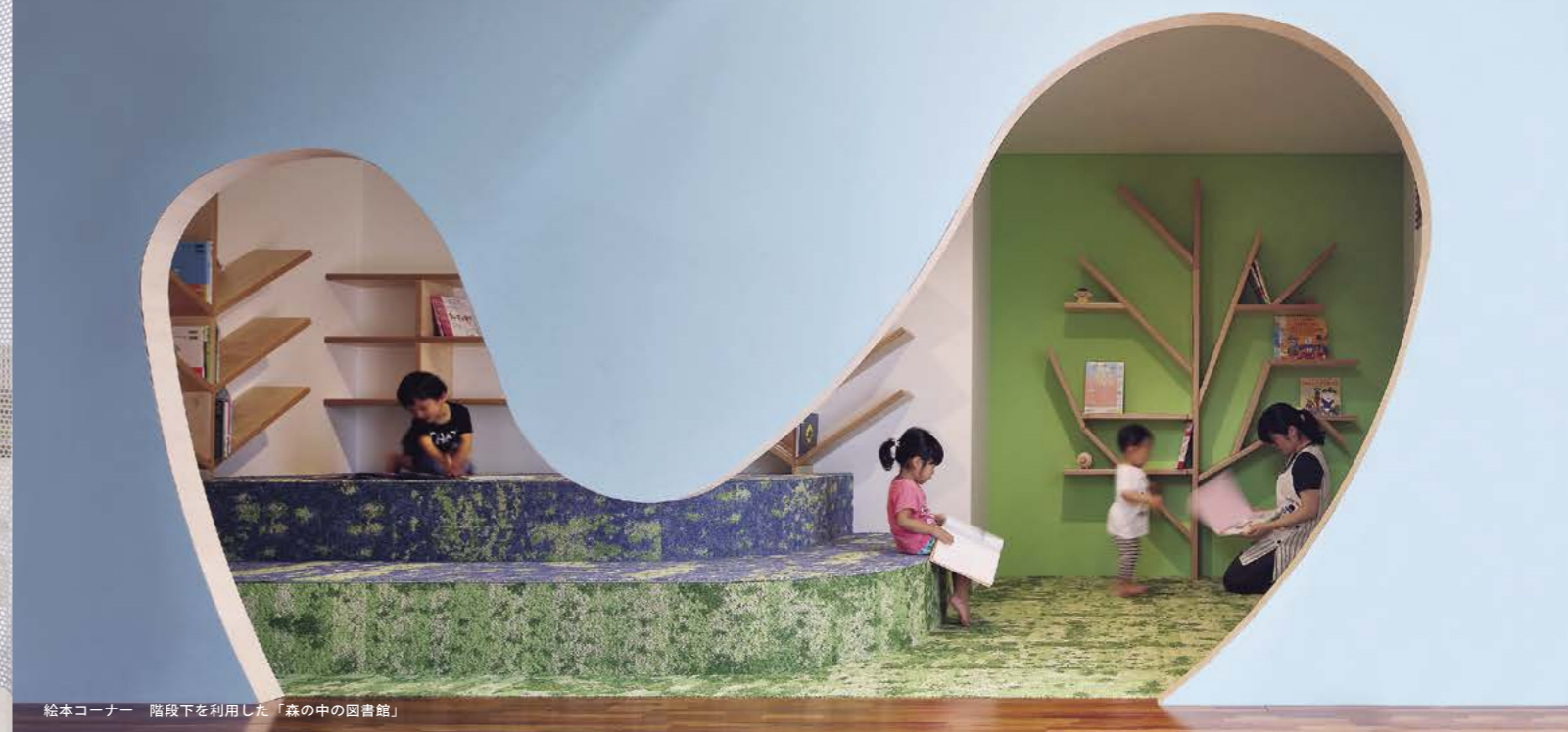
8 絵本コーナー 階段下を利用した「森の中の図書館」