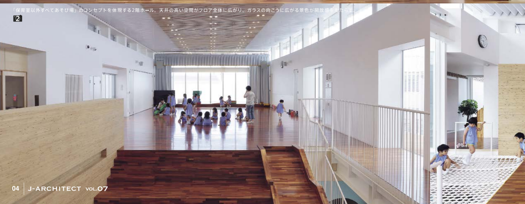
2 「保育室以外すべてあそび場」のコンセプトを体現する2階ホール。天井の高い空間がフロア全体に広がり、ガラスの向こうに広がる景色が開放感をあたります。