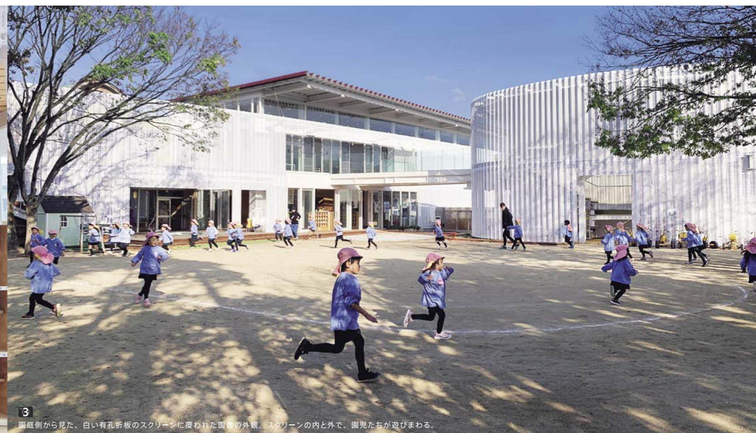
3 園庭側から見た、白い孔折板のスクリーンに覆われた園舎の外観。スクリーンの内と外で、園児たちが遊びまわる。