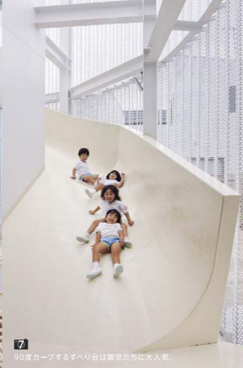
7 90度カーブするすべり台は園児たちに大人気。