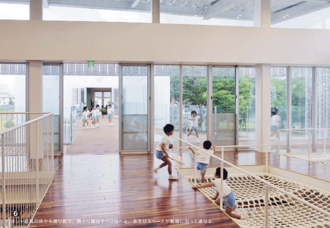
6 ネット遊具の床から渡り廊下、預かり棟のすべり台へと、あそびスペースが動線に沿って連なる。