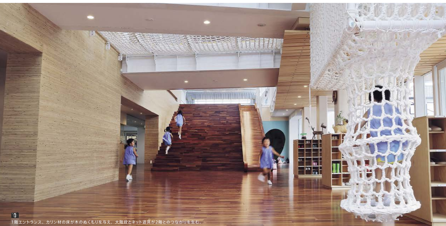
1 1階エントランス。カリン材の床が木のぬくもりを与え、大階段とネット遊具が2階とのつながりを生む。